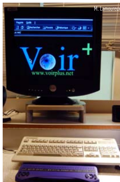
M. Lamoureux Matériel informatique adapté pour les visiteurs déficients visuels (clavier braille, etc.)

En France, un sacré bond a déjà été réalisé au niveau de la culture. D'autres vont suivre... ■■■